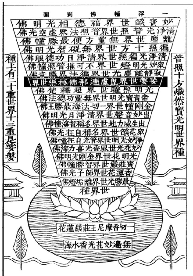
圖(2)華藏莊嚴世界海